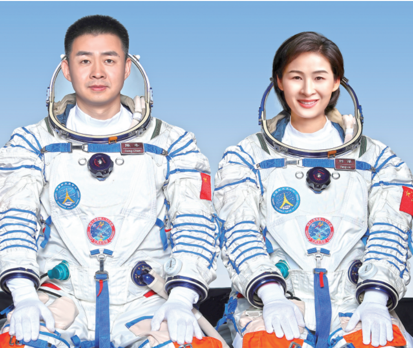
▲据中国载人航天工程办公室消息，经空间站阶段飞行任务总指挥部研究决定，陈冬(中)、刘洋(右)、蔡旭哲3名航天员将执行神舟十四号载人飞行任务，由陈冬担任指令长。