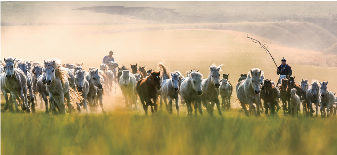
▲初夏时节,内蒙古锡林郭勒盟西乌珠穆沁旗的草原开始返青。当地牧民赶着马匹,来到草原上驯马,景象壮观(五月十七日摄)。