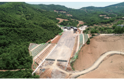
近日,陕西麟游至法门寺高速公路工程建设稳步推进,工人们在现场加紧施工(5月23日摄)。