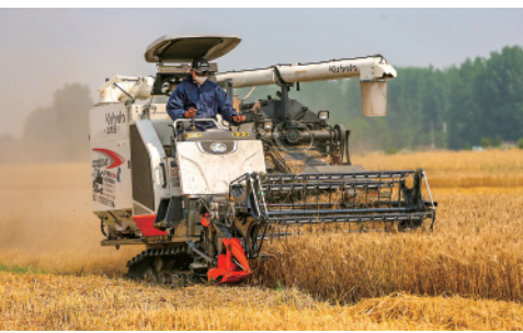
5月25日,在湖北省襄阳市襄城区卧龙镇毛梁村,农民驾驶收割机在田间收割小麦。