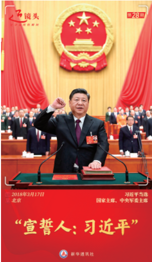
扫描二维码,聆听照片背后的故事。