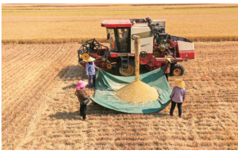
5月23日,在山东省枣庄市亭山区新河村麦田,农机手操作大型收割机收割小麦。