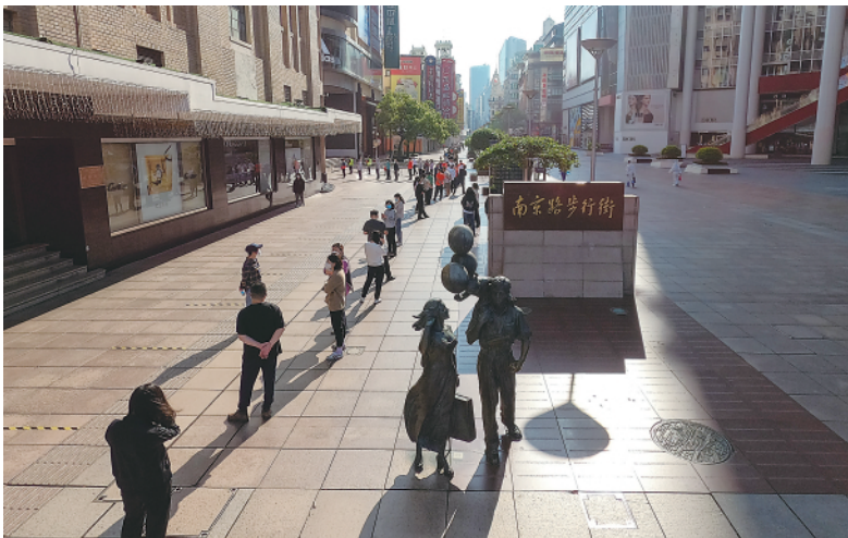
▲在上海市南京路步行街，附近的居民排队进行核酸筛查（5月6日摄）。