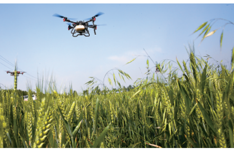
在青岛市平度田庄镇幸福庄村,植保无人机在进行田间作业。眼下山东小麦进入灌浆生长关键期。