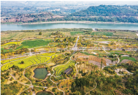
▲ 这是 3 月 10 日拍摄的重庆广阳岛景色。

过去,由于紧邻城区、多头管理等原因,缙云山保护区部分村民“靠山吃山”,农家乐粗放无序发展,不断“蚕食”生态;广阳岛 2010 年前后被列为重点开发对象,一度规划超过 300 万平方米的房地产开发量,开山、