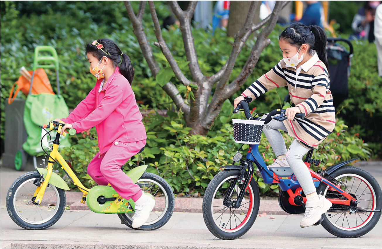
▲ 5 月 17 日,在上海市松江区,小朋友们在骑自行车。

疫情之下,城市按下“暂停键”,2500 万上海市民也多有不便。在基层,逾百万志愿者、机