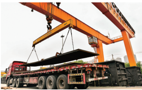
今年4月份以来,国铁济南局精准摸排对接企业运输需求,为产业链、供应链稳定提供运输保障。