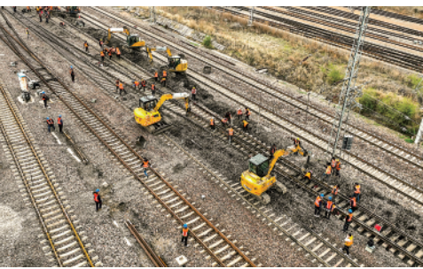
近日,大秦铁路开始为期20天的“体检”,以确保运输效率和线路安全。