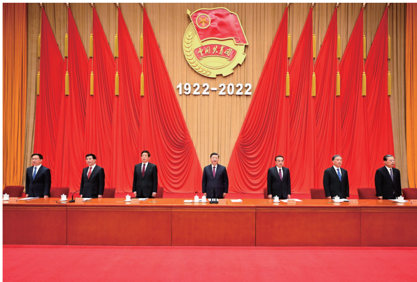
▲5月10日，庆祝中国共产主义青年团成立100周年大会在北京人民大会堂隆重举行。中共中央总书记、国家主席、中央军委主席习近平在大会上发表重要讲话。