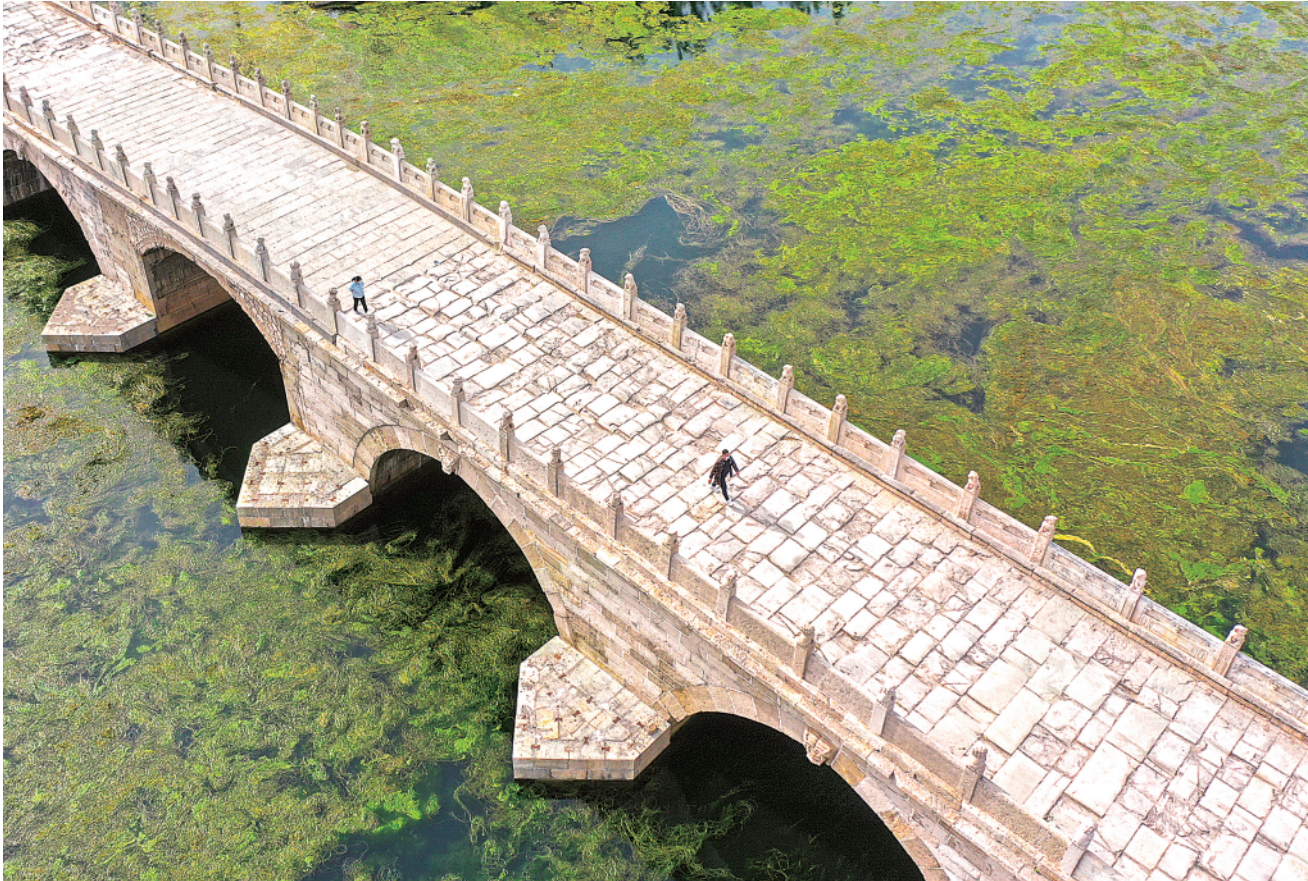
▲完成修缮的衡水安济桥对行人恢复开放(无人机照片)。

的标志性车辙印没了,好好的古桥给毁了。”另有媒体报道称,“原有的石块布有裂痕,桥面中间有车辆长期碾压的车辙痕迹,呈现出沧桑古朴的历史风貌。但桥面中间新铺上一截平整的石材后,车辙痕迹也被截断了。”