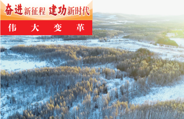
▲3月1日拍摄的塞罕坝机械林场雪后景色。