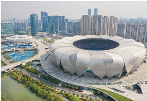
▲ 这是 2022 年 3 月 30 日拍摄的杭州奥体中心体育场（右）和杭州奥体中心网球中心（无人机照片）。