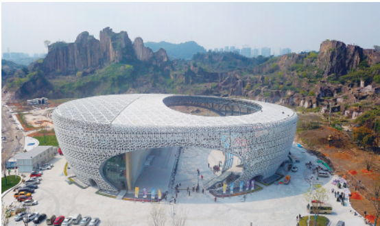
▲ 这是 2022 年 3 月 23 日拍摄的绍兴柯桥羊山攀岩中心（无人机照片）。

新华社杭州电（记者方闻禹、夏亮、朱涵）3 月 31 日，杭州亚运会、亚残运会 56 个竞赛场馆全部竣工并完成赛事功能验收，相关筹备工作进入最后冲刺阶段。