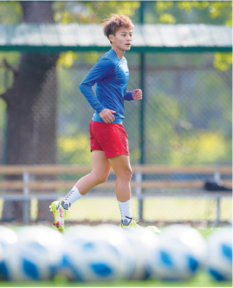
▲ 4 月 6 日，王霜在进行体能康复训练。

四月的武汉艳阳高照。在居民楼与学校环绕的一片寂静绿地上，中国女子金球奖“大四喜”得主王霜与一群十四五岁的学生球员进行区域逼抢训练后，望着他们拉伸的方向若有所思。 “好像回到了小时候。每天下午三点半就到场地，日复一日地这么训练。”王霜笑着说。 因为在亚洲杯期间脚部骨裂，王霜近期一直处于伤病恢复期。上个月月底，她回到湖北省体育局足球运动管理中心，继续进行一个人的康复训练。现阶段，王霜每周训练六天，其中两天“一天两练”。但大部分时间里，她只能在康复师的指导下，进行核心和基础训练。直到上周，她才第一次走上绿茵场带球训练。 “基本上，每天都在重复训练核心力量 and 不同位置的肌肉。这对于恢复期非常重要，但一直重复也特别枯燥、特别磨人心。”她对记者说。