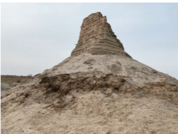
▼克亚克库都克烽燧遗址主体(2019年11月28日摄)。