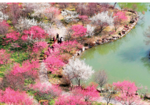
3月6日,游客在江苏扬州瘦西湖风景区赏花游玩。