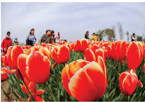
3月6日,游客在四川省遂宁市圣莲花开景区踏青赏花。

今日 12 版 总第 10659 期 / 国内统一连续出版物号 CN 11-0209 邮发代号 1-19 / 新华网:news.cn 新华每日电讯网:mr dx.cn