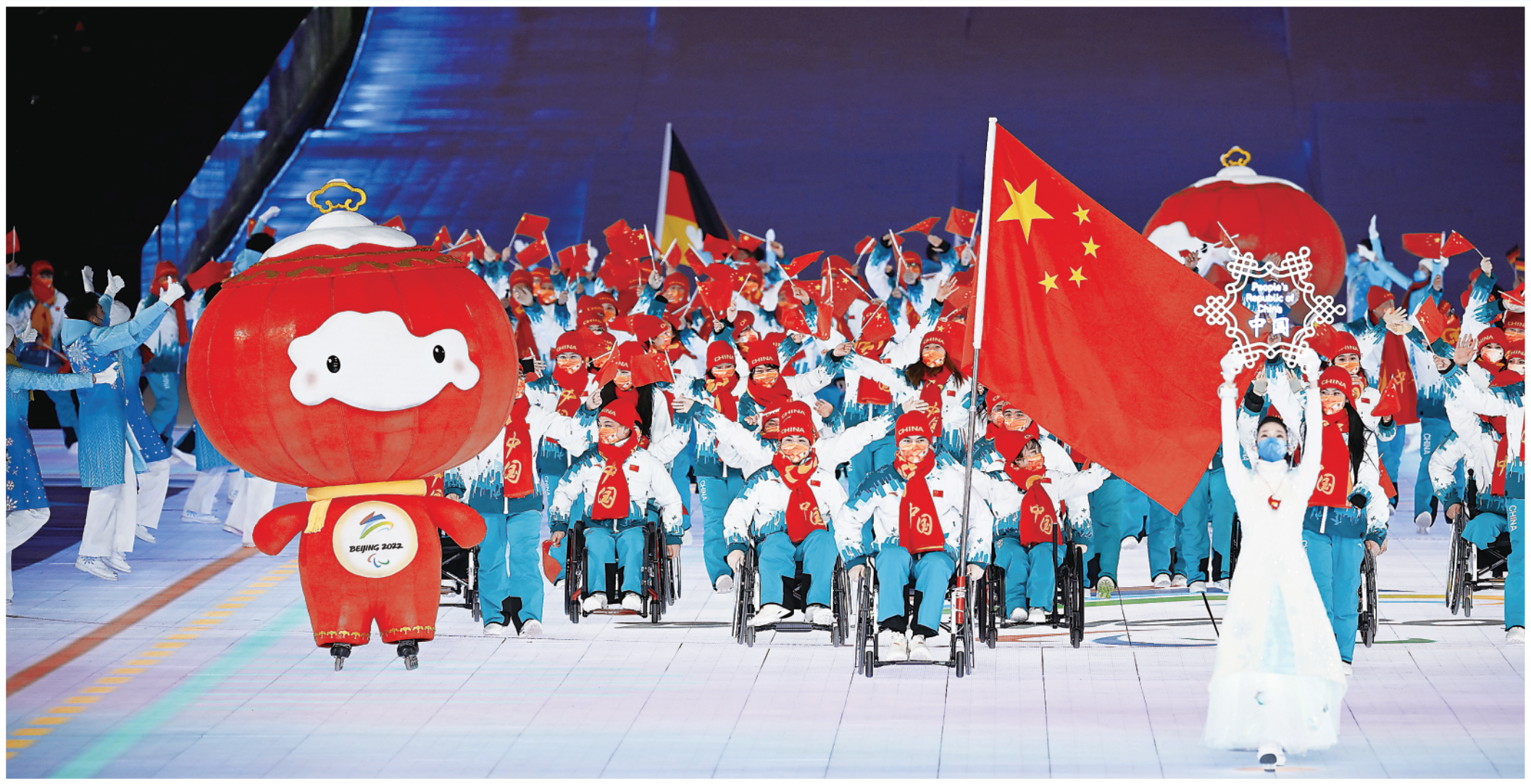
▲3月4日晚,北京2022年冬残奥会开幕式在北京国家体育场举行。这是中国代表团在开幕式上入场。

此外,在这个环节中,四个憨态可掬的冬残奥会吉祥物“雪容融”滑入现场,带出两条“雪道”,与标兵一起热情欢迎各代表团的到来。代表团引导员胸前佩戴的手工编织的“雪容融”挂饰,全部出自残疾人之手,“希望残疾人朋友用一针一线编织出来的‘雪容融’,能带给大家一抹温暖的色彩。”