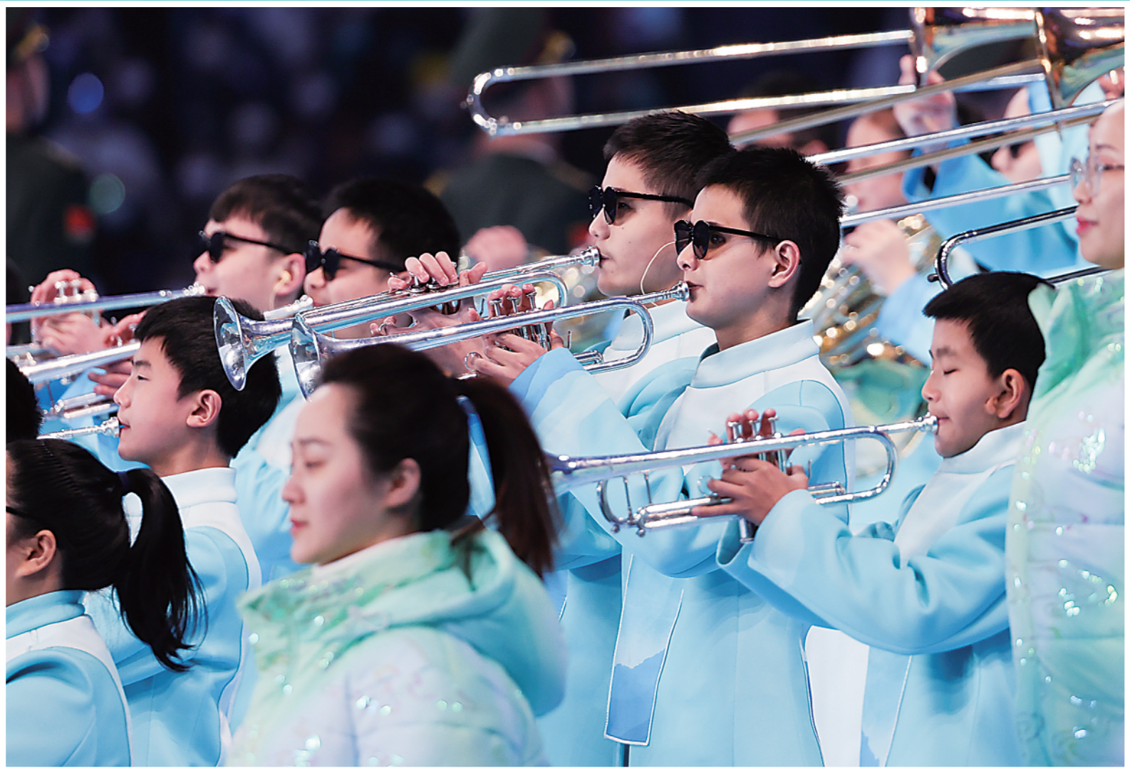
▲盲人管乐团演奏国际残奥委会会歌。