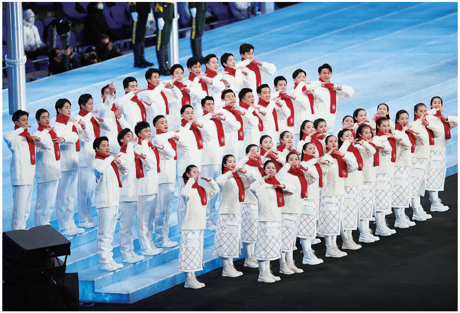
▲人们用手语“演唱”国歌。