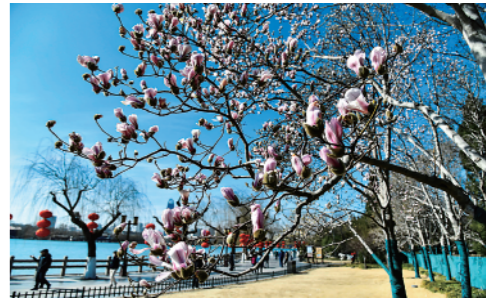
近日,山东省济南市天气晴好气温回升,大明湖景区内玉兰绽放,给城市带来了春天的气息。

今日12版 总第10654期 / 国内统一连续出版物号CN 11-0209 邮发代号1-19 / 新华网:news.cn 新华每日电讯网:mr dx.cn