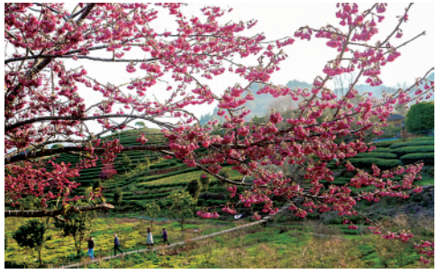
近日,位于福建武夷山的一处生态茶园里新茶吐绿、樱花盛开,红绿相间的早春美景吸引游人前来赏春踏青。