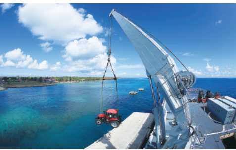
赴汤加执行运送救灾物资任务的中国海军舰艇编队在努库阿洛法港卸载拖拉机(2月19日摄)。