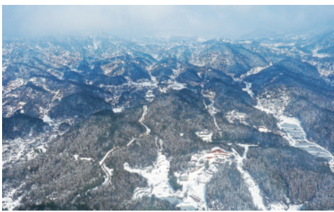
南昌市湾里管理局洗药湖地区的雪后景色。近日,受冷空气影响,江西南昌迎来降雪天气。