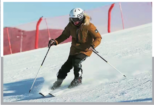
▲新华社记者殷家捷在练习滑雪，更好报道北京冬奥会。