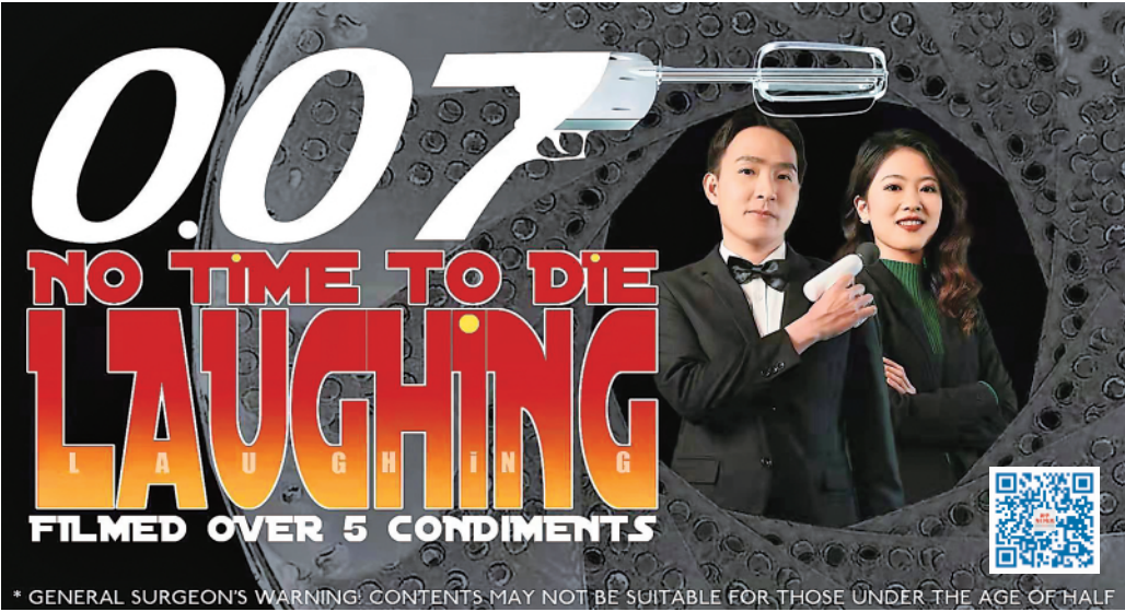
▲扫描图中二维码，欣赏新华社微电影《0.07：无暇笑死》。

从传统通讯社向新型全媒体机构转型，挑战激发出小伙伴们的创作欲——先买票走进电影院，把《无暇赴死》看了一遍，回家又看几部经