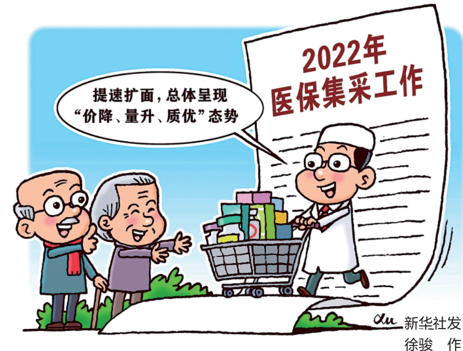
新华社发 徐骏 作

(上接1版)——坚持辩证统一,始终相互促进。 “通过!” 2018年3月20日,人民大会堂。十三届全国人大一次会议表决通过了《中华人民共和国监察法》,热烈的掌声在万人大礼堂响起。 这一反腐败国家立法,将党的十八大以来全面从严治党的理论和实践创新成果,将深化国家监察体制改革的制度成果,以法律形式固定下来,体现了全面从严治党的决心、全面从严治党向纵深发展的坚定意志。 “全面建成小康社会是我们的战略目标,全面深化改革、全面依法治国、全面从严治党是三大战略举措”“让全面深化改革、全面推进依法治国如鸟之两翼、车之双轮”“一以贯之、坚定不移全面从严治党”“为决胜全面建成小康社会、决战脱贫攻坚提供坚强保障”……坚持历史唯物主义和辩证唯物主义认识论和方法论的相统一,坚持战略目标与战略举措的相统一,确保了“中国号”列车全速顺利前进。 ——坚持全面系统,加强整体谋划。 深圳,莲花山。登高眺远,“春天的故事”尽收眼底。习近平总书记亲手种下的高山榕,茂盛挺拔。 2013年11月,党的十八届三中全会一揽子推出330多项改革举措,并决定在党中央成立领导推进全面深化改革的顶层机构。 “不是推进一个领域改革,也不是推进几个领域改革,而是推进所有领域改革”。习近平总书记为这场新时代的改革开放标注出了不同以往的广度和深度。 纵横正有凌云笔,伟大事业谱新篇。 全面建成小康社会,不仅让近1亿人口摆脱贫困,也是经济、政治、文化、社会、生态文明全面发展的更高水平小康;