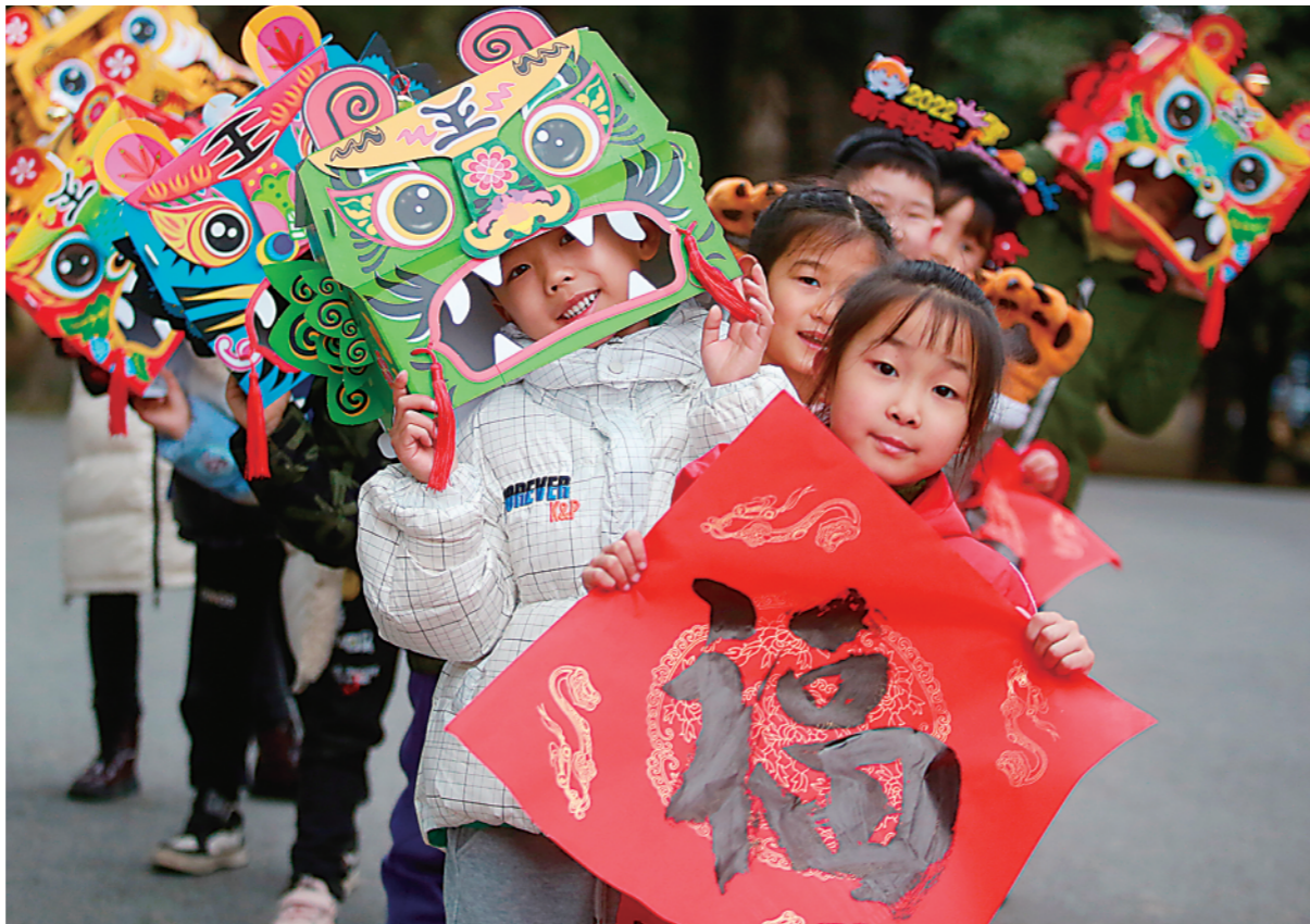
▲1月22日，在江苏省扬州市茱萸湾风景区，小朋友手持福字和虎头帽为游客送上新春祝福。

京东集团首席经济学家沈建光：2021年下半年，伴随多重冲击交织，中国经济下行压力加大，但全年仍实现8.1%的经济增长，在全球主要经济体中名列前茅，彰显了巨大的发展活力和韧性。展望2022年，出口、外商投资、绿色投资、高技术投资、数字经济仍将为中国经济高