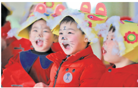
近日,浙江省湖州市德清县洛舍镇中心幼儿园开展“传统文化迎新春”活动,小朋友欢欢喜喜迎接新春佳节。