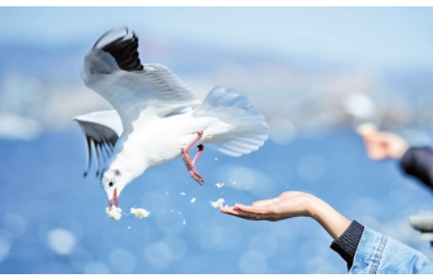
近日,云南省昆明市阳光明媚,滇池海埂大坝游人如织,人鸥同乐成为昆明的一道风景线(1月23日摄)。