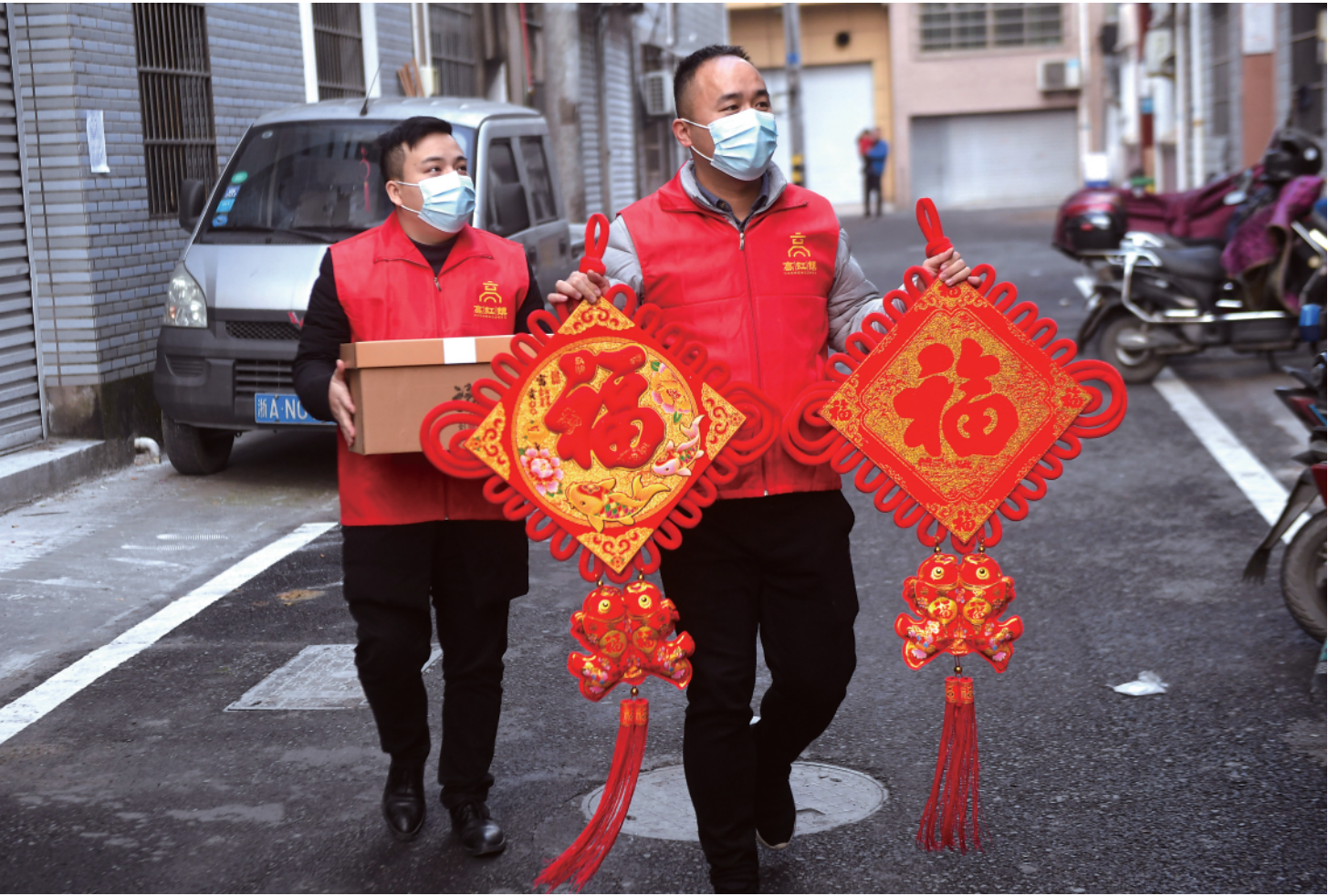
◀一月十一日,杭州市临安区高虹镇的党员志愿者上门给准备留在当地过年的外来务工人员送上“福”字和新春大礼包。

由于疫情的不确定性,还有一些人犹豫走还是留。在北京一家餐厅打工的山西人小宁,已经连续两年没有回家过年。“今年特别想回去,但就怕有疫情到时候回不来。”她说。