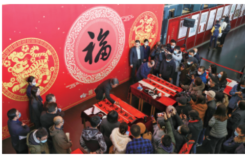
1月18日,“古籍里的春联”发布暨春联书写活动在国家图书馆举行,发布了从古籍文献中撷取的春联21副。

今日 12 版 总第 10612 期 / 国内统一连续出版物号 CN 11-0209 邮发代号 1-19 / 新华网:news.cn 新华每日电讯网:mr dx.cn