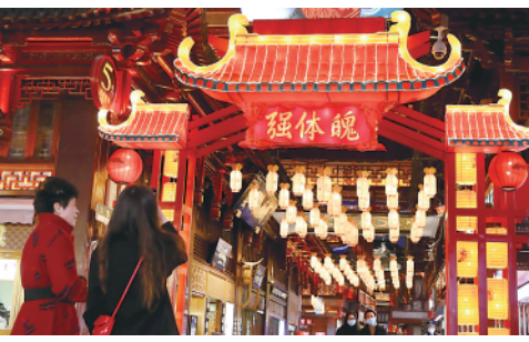
1月18日晚,上海豫园商城中心广场上高约9米的“虎跃东方”生肖虎巨型灯组正式亮灯,喜迎新春。