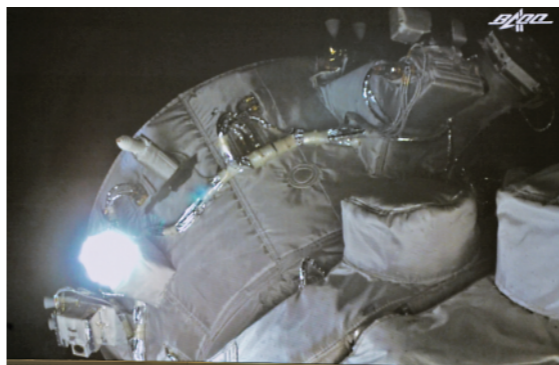
1月8日在北京航天飞行控制中心拍摄的天舟二号货运飞船与空间站组合体精准完成前向交会对接。