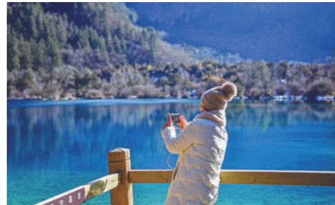
一名游客在九寨沟景区火花海前拍照。隆冬时节,世界自然遗产九寨沟景区呈现迷人的冬季风光。

新华通讯社主管主办 2022年1月9日 星期日 辛丑年十二月初七 新华通讯社出版