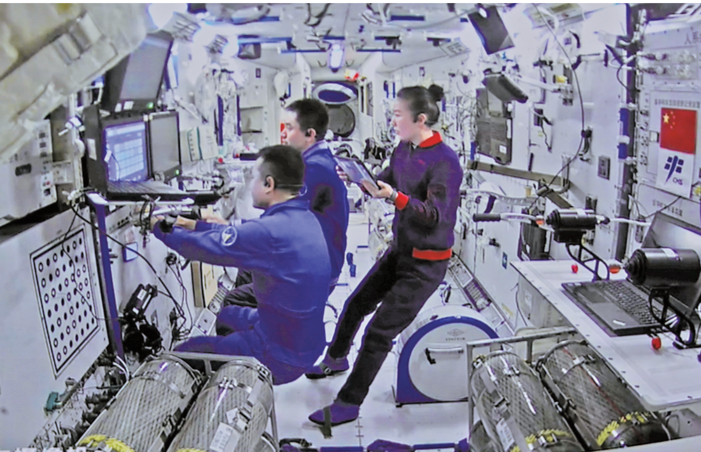
1月8日在北京航天飞行控制中心拍摄的神舟十三号航天员乘组进行手控遥操作天舟二号货运飞船与空间站组合体交会对接试验,航天员通过手控遥操作方式控制货运飞船。