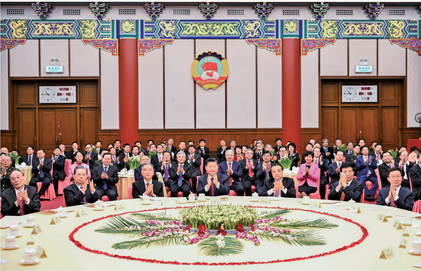
12月31日,全国政协在北京举行新年茶话会。党和国家领导人习近平、李克强、汪洋、王沪宁、赵乐际、韩正、王岐山出席茶话会并观看演出。

新华社北京12月31日电中国人民政治协商会议全国委员会12月31日上午在全国政协礼堂举行新年茶话会。党和国家领导人习近平、李克强、汪洋、王沪宁、赵乐际、韩正、王岐山等同各民主党派中央、全国工商联负