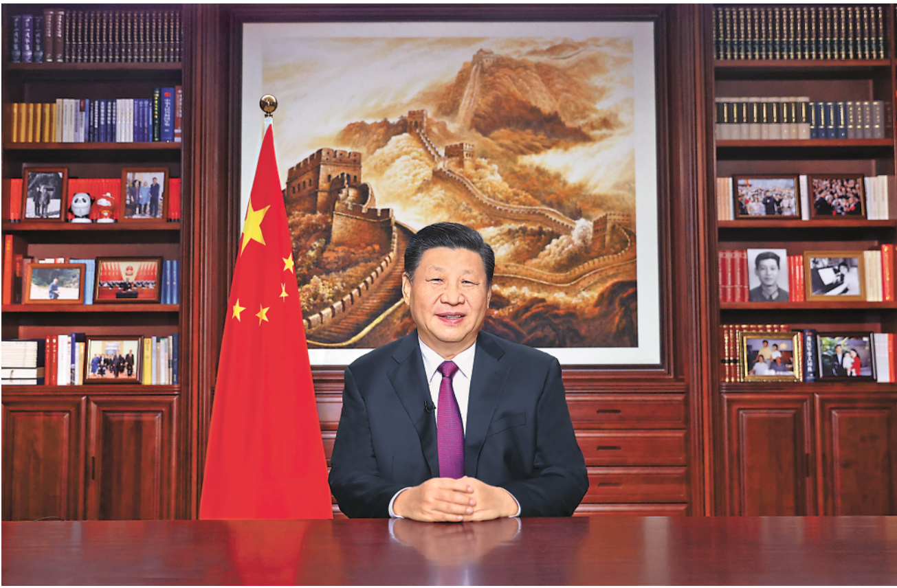
新年前夕,国家主席习近平通过中央广播电视总台和互联网,发表二〇二二年新年贺词。

●在飞逝的时光里,我们看到的、感悟到的中国,是一个坚韧不拔、欣欣向荣的中国。这里有可亲可敬的人民,有日新月异的发展,有赓续传承的事业 ●历史征程风云激荡,中国共产党人带领亿万人民经千难而百折不挠、历万险而矢志不渝,成就了百年大党的恢宏气象 ●不忘初心,方得始终。我们唯有踔厉奋发、笃行不怠,方能不负历史、不负时代、不负人民 ●我们要常怀远虑、居安思危,保持战略定力和耐心,“致广大而尽精微” ●大国之大,也有大国之重。千头万绪的事,说到底是千家万户的事 ●民之所忧,我必念之;民之所盼,我必行之 ●我们将竭诚为世界奉献一届奥运盛会。世界期待中国,中国做好了准备