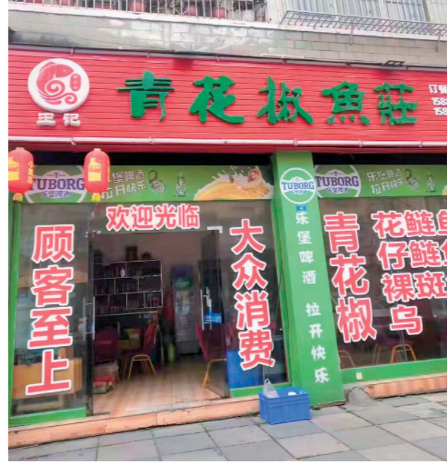
王记青花椒鱼庄的门店店招。

专家表示，商家非法采集消费者人脸信息已涉嫌违法。消费者权益保护法明确规定，经营者收集、使用消费者个人信息，应当遵循合法、正当、必要的原则，明示收集、使用信息的目的、方式和范围，并经消费者同意。2020年10月实施的《信息安全技术个人信息安全规范》也明确规定，人脸信息属于生物识别信息，也属于个人敏感信息，收集个人信息时应获得个人信息主体的授权同意。2021年7月28日，最高人民法院发布关于审理使用人脸识别技术处理个人信息相关民事案件适用法律若干问题的规定，进一步将作为个人信息收集前提的“同意”细化为“单独同意”。2021年11月1日起施行的个人信息保护法第26条规定，在公共场所安装图像采集、个人身