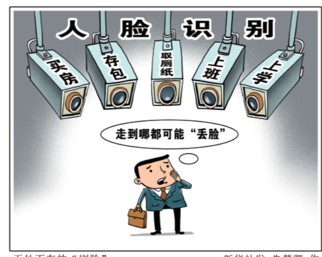
无处不在的“刷脸” 新华社发 朱慧卿 作

份识别设备，应当为维护公共安全所必需，遵守国家有关规定，并设置显著的提示标识。所收集的个人图像、身份识别信息只能用于维护公共安全的目的，不得用于其他目的；取得个人单独同意的除外。