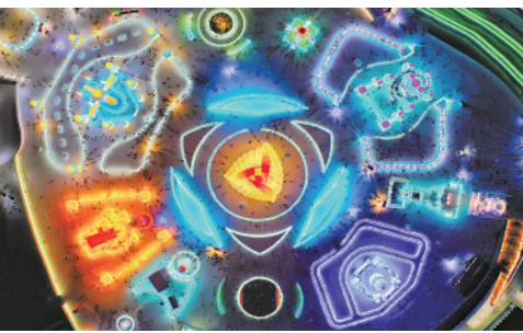
12月25日,游客在哈尔滨冰雪大世界景区游玩(无人机照片)。当日,第二十三届哈尔滨冰雪大世界开园。