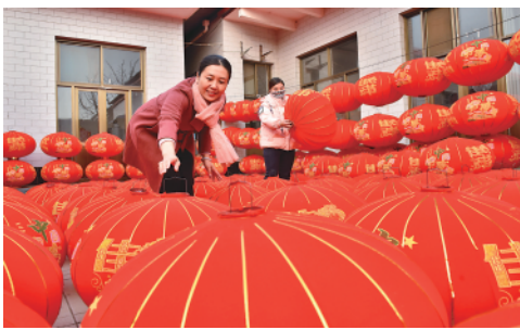
新年临近,河北省邢台市南和区东三召乡的灯笼作坊赶制各式灯笼,供应市场(12月22日摄)。