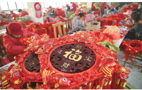
近日,山东郑城红花镇一家企业的工人在加工“中国结”。临近新年,当地生产的“中国结”迎来销售旺季。