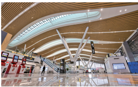
12月15日,贵阳龙洞堡国际机场3号航站楼正式启用(12月14日摄)。