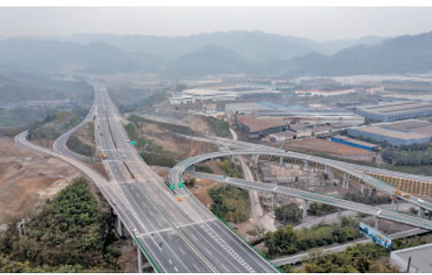
目前,渝黔高速公路扩能项目万盛段已全面进入收尾施工阶段,预计年内将实现通车(12月14日摄)。