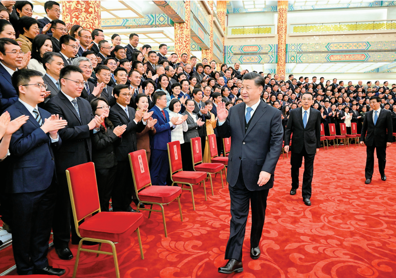
12月15日,党和国家领导人习近平、李克强、王沪宁等在北京人民大会堂会见中华全国新闻工作者协会第十届理事会第一次会议暨中国新闻奖颁奖会代表。