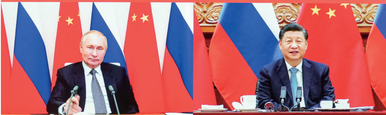
12月15日下午,国家主席习近平在北京同俄罗斯总统普京举行视频会晤。

ВСТРЕЧА ПРЕДСЕДАТЕЛЯ КНР СИ ЦЗИНЬПИНА И ПРЕЗИДЕНТА РФ В. В. ПУТИНА В ФОРМАТЕ ВИДЕОКОНФЕРЕНЦИИ