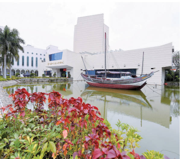
上图：泉州海外交通史博物馆外景（2019年3月1日摄）。泉州自古就是海上丝绸之路的重镇，泉州海外交通史博物馆（海交馆）展出的反映古代海外交通、海上丝绸之路及由此引发的经济、文化交流的海外交通史文物，生动再现了中国古代悠久辉煌的海洋文化。

2021年12月3日，随着“澜沧号”和复兴号动车组列车从万象站和昆明站分别驶出，中老铁路正式全线