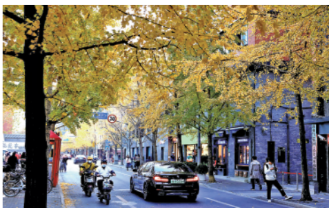
12月5日,车辆、行人从局门路街头的银杏树下经过。初冬时节的上海街头,银杏树披上一层金黄,美景如画。