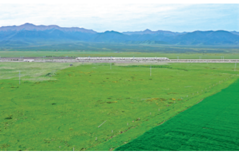
动车组列车从祁连山下山丹马场穿行而过。山丹马场站位于甘肃山丹县,海拔超过3000米,目前已正式开办客运业务。