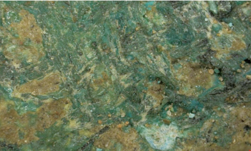
三星堆二号“祭祀坑”出土的青铜人头像局部上检测到的纺织物痕迹。