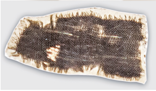
20 世纪 50 年代钱山漾遗址出土的家蚕丝绢片。