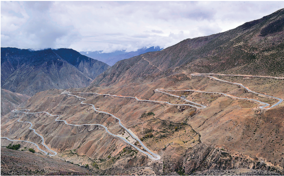
上图：这是川藏公路西昌都市境内的“怒江72拐”（2016年5月15日摄）。

历史照亮未来，奋斗未有穷期。全国上下正在积极响应号召，以史为鉴、开创未来，埋头苦干、勇毅前行，为实现第二个百年奋斗目标、实现中华民族伟大复兴的中国梦而不懈奋斗。（记者肖春飞、吴振东、郭敬丹、程迪、郑昕、闫超磊）新华社北京11月18日电