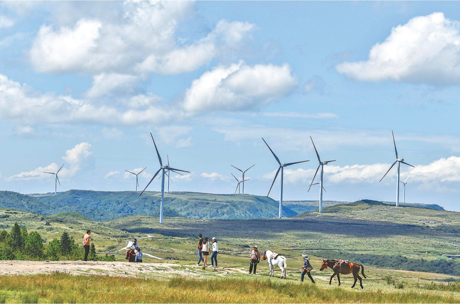
游客在贵州省龙里县龙里大草原的风电场观光(9月21日摄)。

2011年，贵州首座风力发电站并网发电，十年间，高山与河谷边建起一座座“绿色电站”。如今，贵州新能源发展可谓“风光无限”。截至