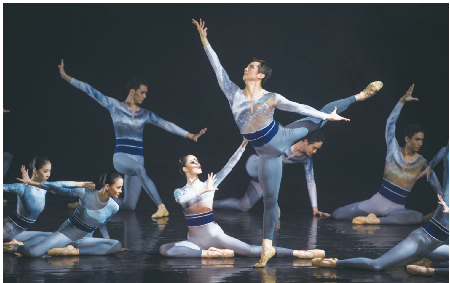
11月3日，中央芭蕾舞团演员表演原创交响芭蕾《山河》。

本书从一个侧面真实生动书写了党领导中华民族迎来从站起来、富起来到强起来的伟大飞跃，其中一些经典之作或脍炙人口、传诵一时，或被选入学校教科书。这些精品佳作，充分展现了以穆青为代表的一代代新闻人做党的政策主张传播者、时代风云记录者、社会进步推动者、公平正义守望者的初心、使命与风采。