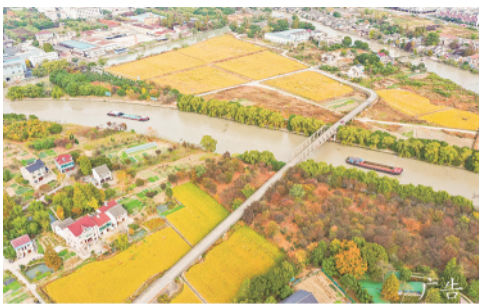
浙江湖州南浔区练市镇松亭村，田野里一片金黄，色彩斑斓，呈现出一幅美丽画卷。