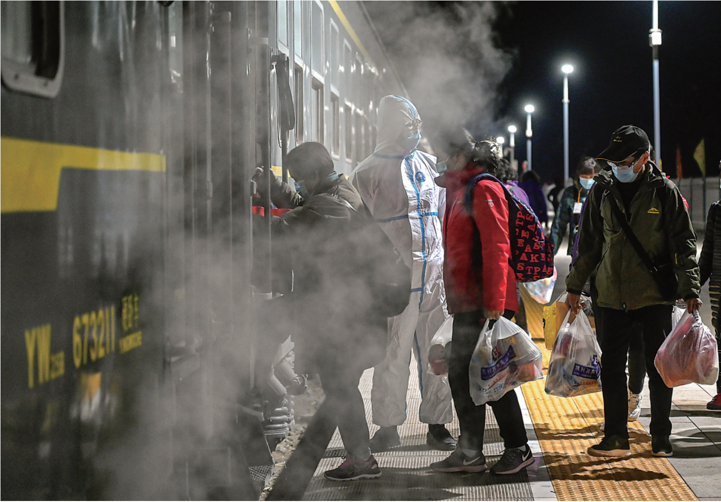
10月27日，滞留游客在额济纳站站台登上列车。当日，额济纳旗首批滞留游客乘旅游专列返程。 另外，因疫情滞留额济纳旗的自驾游客自10月28日开始返程。首批返程自驾游客共有128人，驾驶车辆42台。自驾游客车队在公安车辆引导下，启程前往阿拉善左旗敖伦布拉克镇，到达后在酒店隔离14天，符合相关条件可以自行返家。

10月27日夜间，一列从郑州始发的旅游专列，在内蒙古自治区额济纳旗滞留10天后，踏上返程之旅。 随着首批586名滞留游客平安有序离开额济纳旗，当地正式开启了滞留游客转运工作。 27日傍晚，3辆旅游大巴车缓缓停在额济纳旗胡杨小镇门口，住在这里的3个老年旅行团成员排队登上大巴车，准备前往火车站。 大巴车司机杨志刚站在车门外，叮嘱上车的老人注意脚下安全。 杨志刚是胡杨林景区的摆渡车司机，疫情发生后成为志愿者，接到运送滞留游客去火车站的任务后，他将大巴车里里外外做了消杀。 “游客能平安回家，我们都很开心。”杨志刚说。 游客们一边排队上车，一边和两边送行的工作人员道谢。他们对杨志刚说：“等疫情过去了，我们再来坐你的摆渡车。” 该旅游专列于18日6时抵达额济纳旗，游客们正在胡杨林景区游玩时突然接到通知，额济纳旗为加强疫情防控，从18日7时起关闭出入旗通道。 “当时一下子就懵了，不知道要去哪，不知道怎么办。”江苏游客朱先生说，“回不去家，每天待在饭店里，上升的病例数让我们恐慌又迷茫。” 后来，当地疫情防控工作人员与旅行团取得联系，从22日开始提供送餐送药服务，生活得到了保障，大家情绪慢慢平稳了。“现在要返程了，既是归心似箭，又有点恋恋不舍，在额济纳旗酸甜苦辣的感觉都有，也交到了好多朋友。”即将踏上返程列车的朱先生说。 餐馆老板赵爱平，就是朱先生在疫情期间交到的一个朋友。 赵爱平的餐馆在朱先生所住旅店的隔壁，疫情期间餐馆关闭了堂食，但是游客可以点外卖。赵爱平发现，老年游客点的餐一天比一天便宜，“老年人出门在外这么多天，都不舍得花钱了。”于是，他免费给滞留游客做了一桌菜，有炖排骨、酱牛肉等。 “我给他发微信红包，被他退回了。”朱先生说。