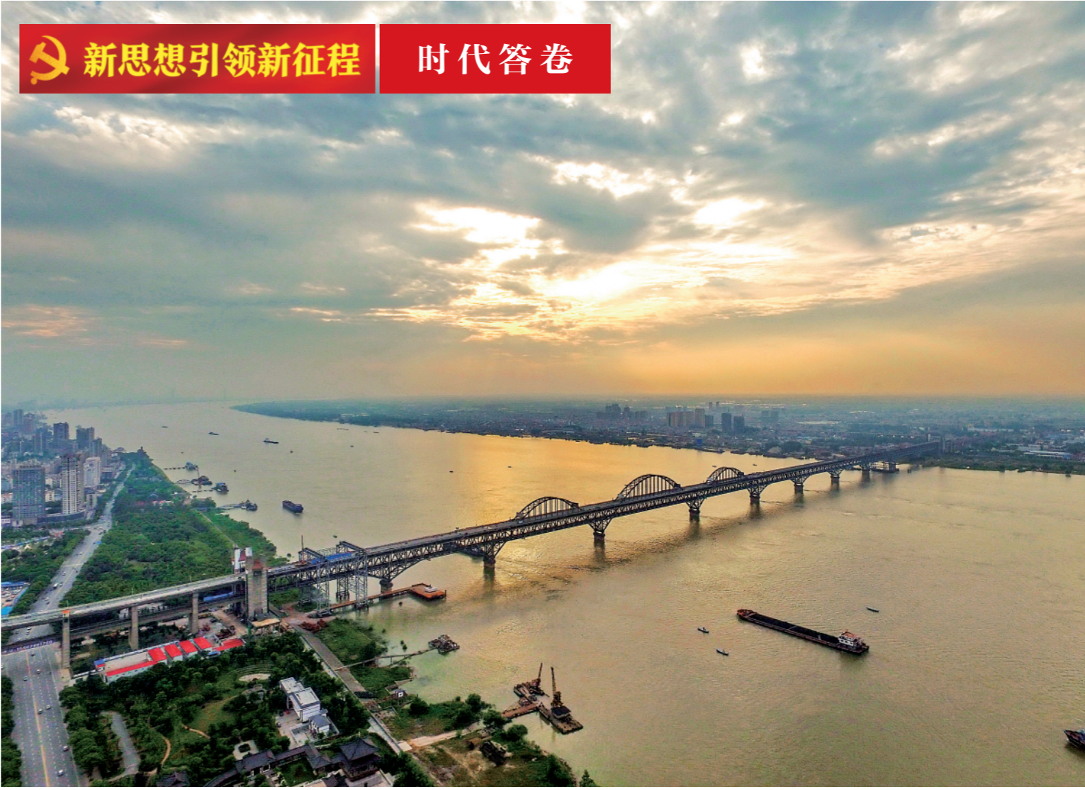
这是2016年5月18日拍摄的长江九江段沿岸景色（无人机照片）。

马拉佩表示，45年前，巴新在太平洋岛国中率先承认一个中国。45年来，两国关系保持了良好发展势头。感谢中方长期以来无私支持