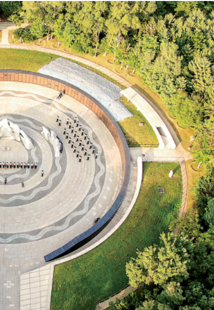
左图：2020年10月12日航拍的沈阳抗美援朝烈士陵园下沉式纪念广场。 右图：这是在辽宁沈阳抗美援朝烈士陵园举行的敬献花篮仪式（2020年10月23日摄）。

建的同时，便有烈士遗体相继送来安葬。1953年2月，孙占元、黄继光、邱少云三位烈士的遗体被运送到沈阳，安葬在这里。