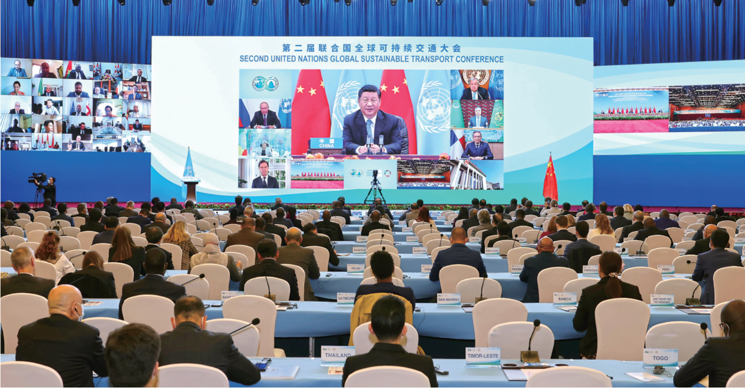
10月14日晚,国家主席习近平以视频方式出席第二届联合国全球可持续交通大会开幕式并发表题为《与世界相交 与时代相通 在可持续发展道路上阔步前行》的主旨讲话。

新华社北京10月14日电国家主席习近平14日晚以视频方式出席第二届联合国全球可持续交通大会开幕式并发表题为《与世界相交 与时代相通 在可持续发展道路上阔步前行》的主旨讲话。(讲话全文见2版) 习近平指出,交通是经济的脉络和文明的纽带。从古丝绸之路的驼铃帆影,到航海时代的劈波斩浪,再到现代交通网络的四通八达,交通推动经济融通、人文交流,使世界成了紧密相连的“地球村”。当前,百年变局和世纪疫情叠加,给世界经济发展和民生改善带来严重挑战。我们要顺应世界发展大势,推进全球交通合作,书写基础设施联通、贸易投资畅通、文明交融沟通的新篇章。 第一,坚持开放联动,推进互联互通。要推动建设开放型世界经济,不搞歧视性、排他性规则和体系,推动经济全球化朝着更加开放、包容、普惠、平衡、共赢的方向发展。要加强基础设施“硬联通”、制度规则“软联通”,促进陆、海、天、网“四位一体”互联互通。 第二,坚持共同发展,促进公平普惠。各国一起发展才是真发展,大家共同富裕才是真富裕。只有解决好发展不平衡问题,才能够为人类共同发展开辟更加广阔的前景。要发挥交通先行作用,加大对贫困地区交通投入,让贫困地区经济民生因路而兴。加强南北合作、南南合作,为最不发达国家、内陆发展中国家交通基础设施建设提供更多支持,促进共同繁荣。(下转4版)