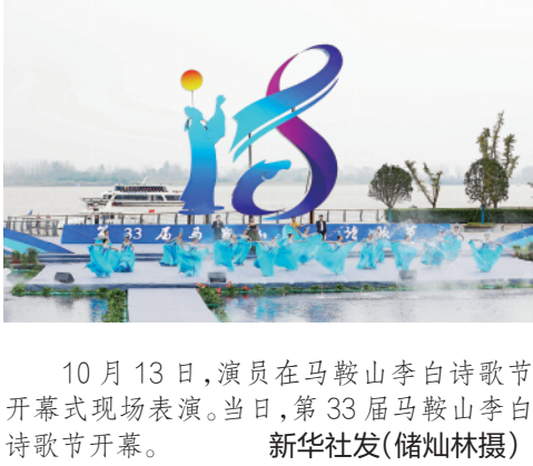
10月13日,演员在马鞍山李白诗歌节开幕式现场表演。当日,第33届马鞍山李白诗歌节开幕。