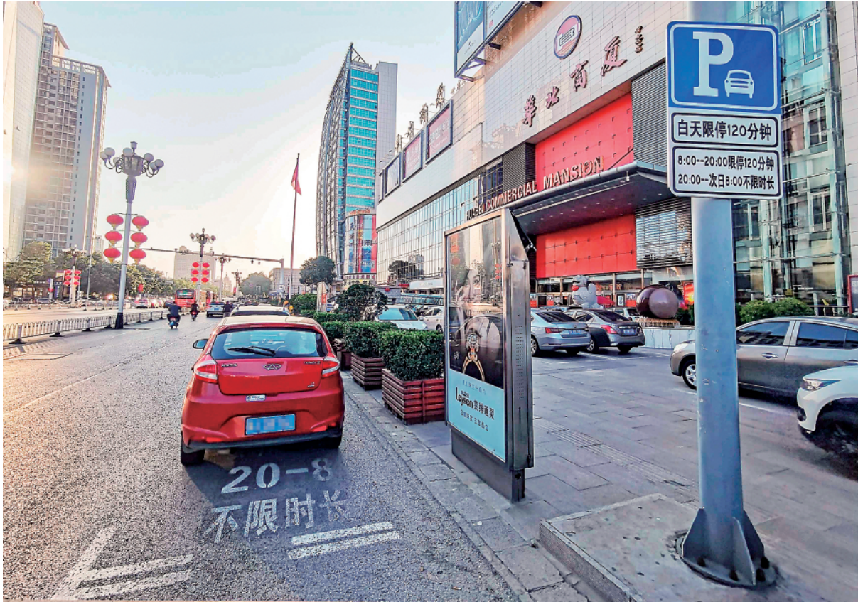
在沧州市一商厦附近，设有不同时段的限时停车泊位。

同时，沧州市交警支队在路缘石以下的非机动车道划出1.7万个免费公共停车位。从2020年10月开始，市区202个党政机关、事业单位的