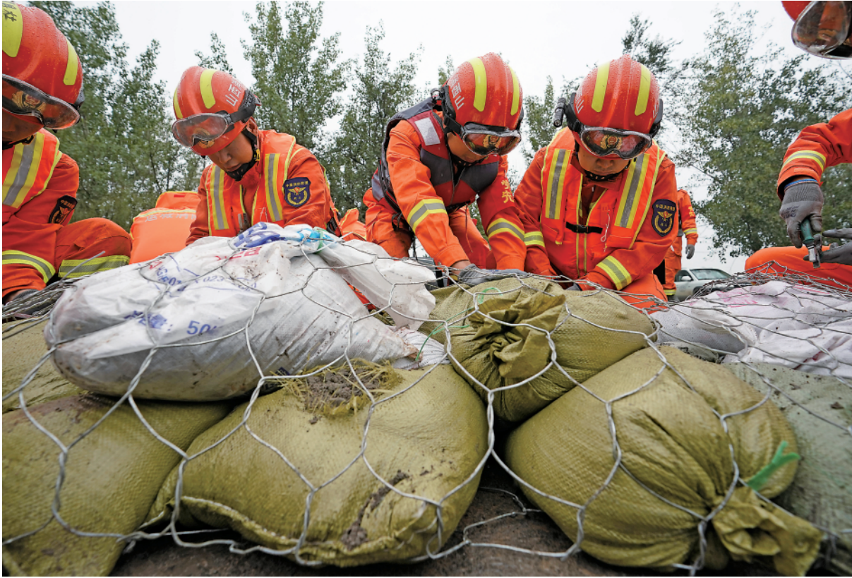
十月十一日,抢险人员在汾河下游稷山段下迪河坝段加固堤坝。