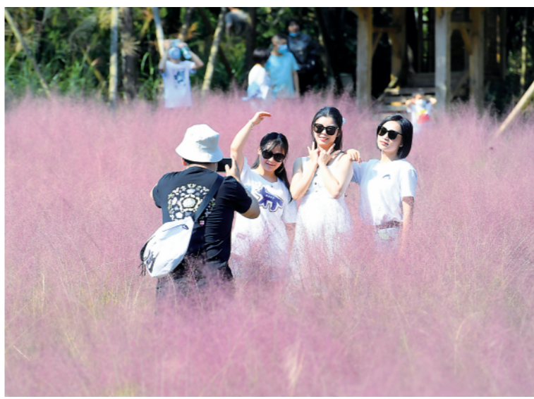
上图：10月2日，在重庆市武隆区仙女山镇懒坝大地艺术景区，游客在粉黛乱子草丛中拍照留念。新华社记者唐奕摄