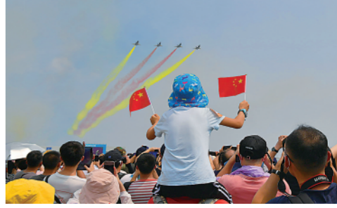
10月1日，中国空军八一飞行表演队在第十三届中国国际航空航天博览会上进行飞行表演。

今日4版 总第10503期 / 国内统一连续出版物号CN 11-0209 邮发代号1-19 / 新华网:news.cn 新华每日电视网:mr dx.cn