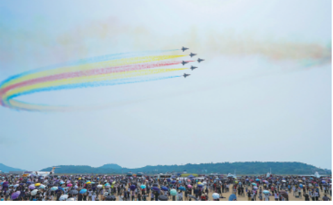
10月1日，在广东珠海举行的第十三届中国国际航空航天博览会迎来首个公众开放日。