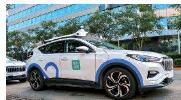
百度无人车出行服务平台“萝卜快跑”车辆。

智能物联网领域企业中电海康集团有限公司相关负责人认为，自动驾驶功能将逐渐成为未来汽车的标配。汽车产业的生态体系，将逐渐向电动化、智能化、网联化等趋势转移，自动驾驶系统所需的摄像头、激光雷达、计算芯片、人工智能算法、车联网技术