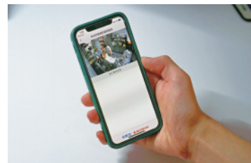
消费者通过外卖平台“阳光厨房”页面查看商家后厨实时情况。