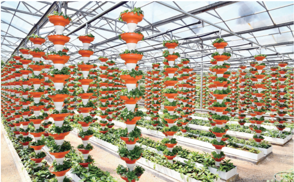
寿光国际蔬菜科技博览会展馆里展示的不同品种西红柿。

体，发展农民合作社22万家，家庭农场8.2万余家，社会化服务组织20多万家，农业生产服务面积达1.46亿亩次，数量均居全国前列。