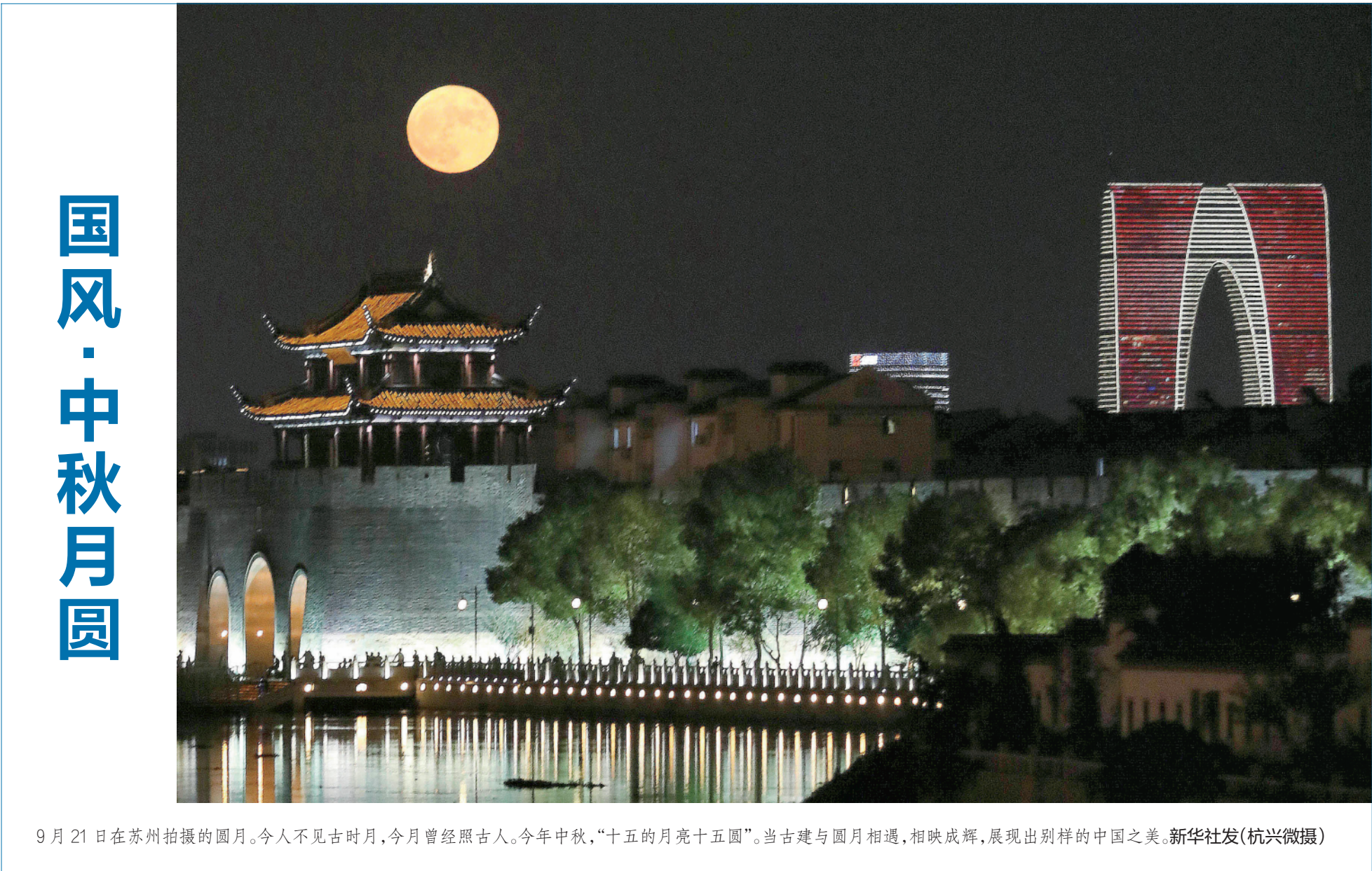
9月21日在苏州拍摄的圆月。今人不见古时月，今月曾经照古人。今年中秋，“十五的月亮十五圆”。当古建与圆月相遇，相映成辉，展现出别样的中国之美。

“人流量爆表！原本只准备1300份小礼品，现在‘省’着发也送出了2000份。”现场工作人员魏薇忙得不亦乐乎。在她看来，