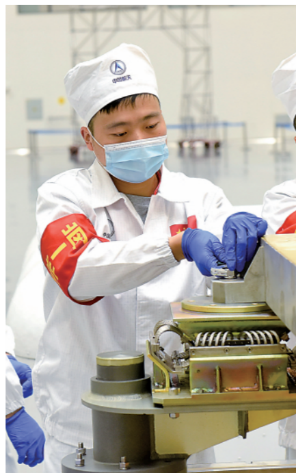
左图：7月下旬，八院试验队员在天舟三号研制现场工作。

目前，八院805所不仅承担了核心舱上的用于接受航天器来访的5个被动对接机构，还包括后续两个实验舱、以及空间站运营阶段每一艘飞船的主动对接机构的研制生产