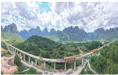
9月16日,贵(阳)南(宁)高铁捞村双线特大桥合龙。贵南高铁是国家规划包头至海口通道的重要组成部分。

今日 4 版 总第 10490 期 / 国内统一连续出版物号 CN 11-0209 邮发代号 1-19 / 新华网:news.cn 新华每日电讯网:mr dx.cn