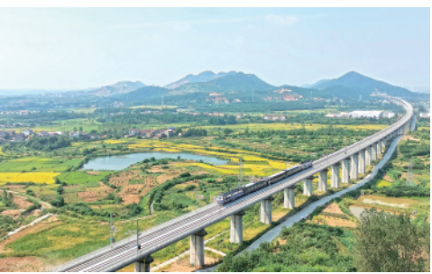
9月16日,安(庆)九(江)高铁安庆至黄梅段开始联调联试,安九高铁是国家规划京港(台)通道的重要组成部分。