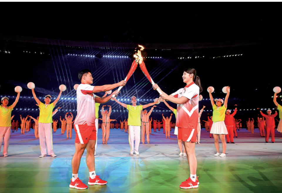
9月15日,火炬手苏炳添(左)与张雨霏在传递中交接。

与郭文珺交接,乒乓球大满贯得主马龙斗志昂扬、步伐轻快,在亿万双眼睛的注视下,用“旗帜”引领“旗帜”,将最后一棒火炬手的使命交给了射落东京奥运会首金的“00后”选手杨倩。此时,在体育场一侧矗立的主火炬塔——“复兴之火”已呈现在世人面前。