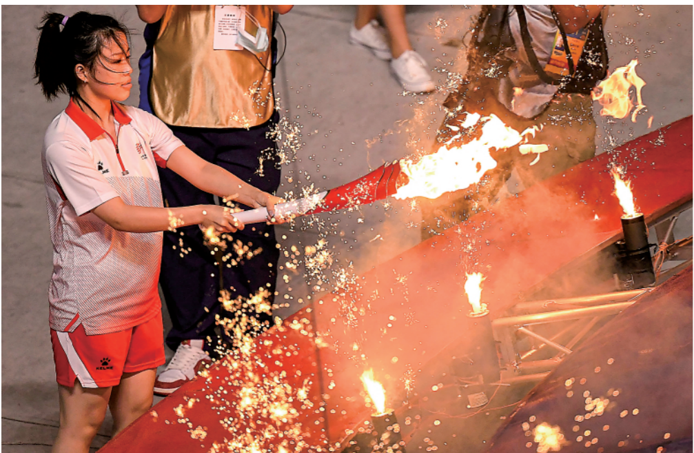
9月15日,火炬手杨倩点燃主火炬。

15日21时27分许,在华夏文明重要发祥地之一、红色热土陕西的西安奥体中心体育场,灯光璀璨、掌声雷动。欢腾的场内倏忽间有光亮闪过,火苗跳跃宛若精灵。