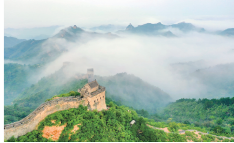
9月3日,连续降雨后的河北省承德市滦平县金山岭长城景区出现壮美的云海景观。