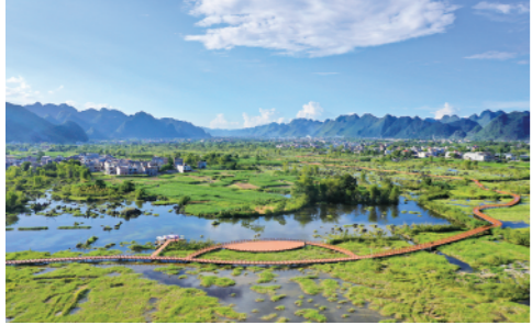
秋日,广西都安瑶族自治县澄江国家湿地公园内碧水幽曲,飞鸟成群,景色优美。

今日4版 总第10475期 / 国内统一连续出版物号CN 11-0209 邮发代号1-19 / 新华网:news.cn 新华每日电视网:mr dx.cn