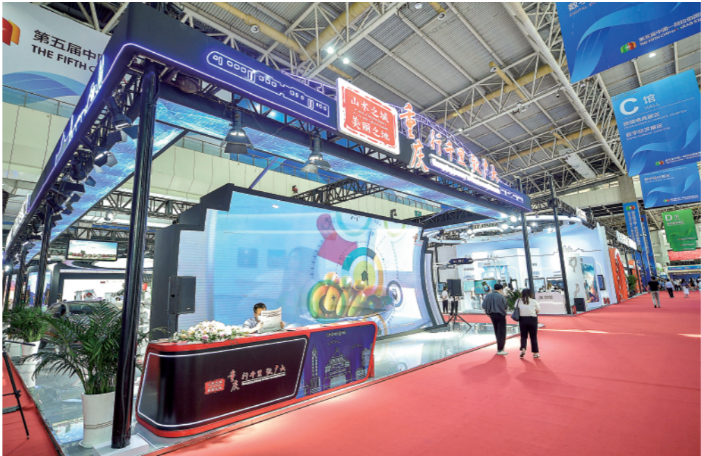
第五届中国-阿拉伯国家博览会银川国际会展中心主题省(市)重庆馆(8月19日摄)。